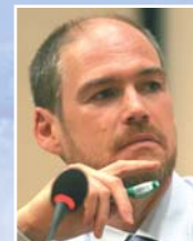
Prof. Edouard Bard Collège de France, Paris

T he Earth has remained habitable throughout most of its history despite substantial changes in solar luminosity and atmospheric composition. The early atmosphere was low in O 2 and rich in the greenhouse gases CO 2 and methane. The rise of atmospheric O 2 around 2.4 billion years ago destroyed the methane greenhouse and triggered a series of glaciations, some of them of apparent global extent. Global, « Snowball Earth » glaciations recurred, around 600 and 750 million years ago, and these again were likely triggered by rapid changes in atmospheric composition.